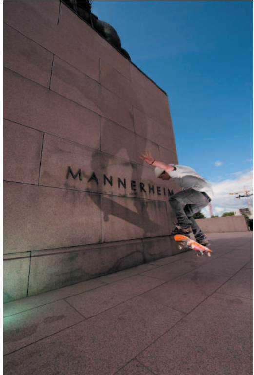
KARI MARKOVAARA Street 8

- Kuvasta ei saa poistaa mitään olennaista muuten kuin rajaamalla kuvaa, esim. kameran kennossa ole-