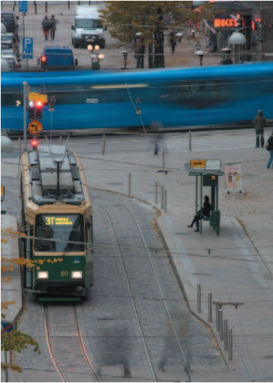
OSSI HAKANEN Mikonkatu 2

va roska voidaan poistaa kuvasta, mutta ei esim. tahraa kuvassa olevassa ikkunassa.