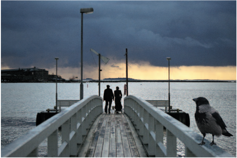
VESA JAKKULA Cul-de-sac

tui toteuttamaan kahdessa viikossa. Tätä ennen hän ei ollut julkaissut kuvia. Yleensä kuvattavat kasvikohteet Jussi löytää kotipihalta tai mökiltä. Jussi esitteli kasvukuvia, hyönteiskuvia sekä matkoilta otet-