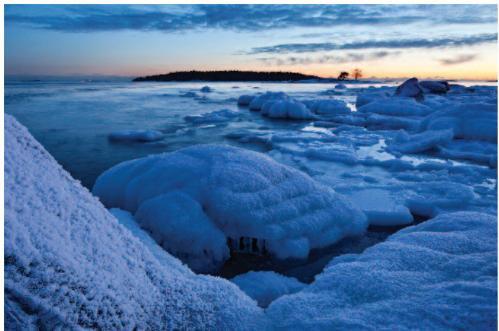
MIKAEL RANTALAINEN Icy landscape

See you everyone soon in our next meeting!