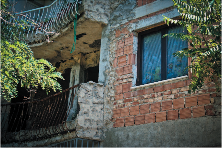
ANTTI NUMMIRANTA Ehjä