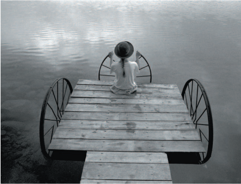
JOUKO LINDGRÉN Tuulia, Kesälahti 1988