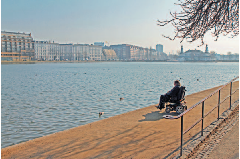
RISTO HEIKKILÄ Sivullinen