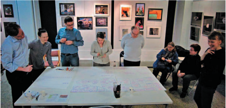
Fiilisfotareita valitsemassa parhaita ideoita.