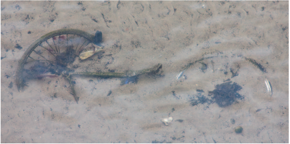
OSSI HAKANEN Pyörä