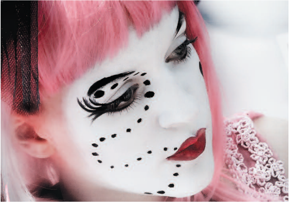
HANNU KONTKANEN Red hair girl 2

kentelystä tietokoneella ja kuvien rakentamisen ja säätäminen omanlaiseksi on hänelle olennaista. Väri ja geometriset muodot ovat hänestä kiinnostavia sekä kauhuklassikkokuvat.