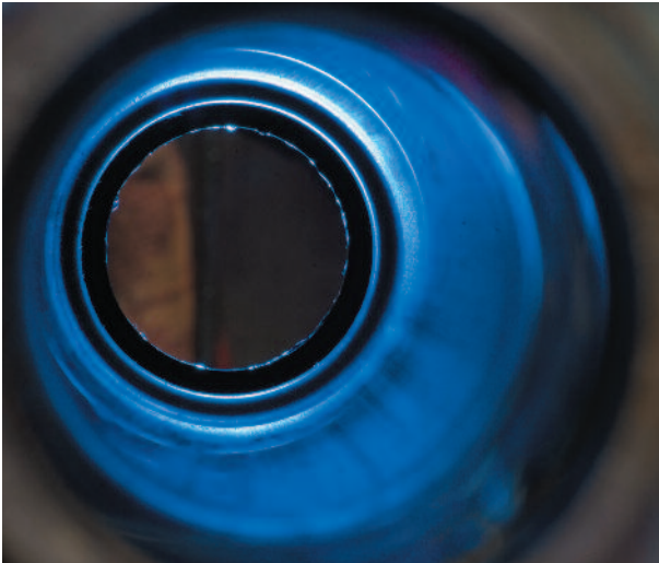
SAKU PARKKINEN Ehjä 3