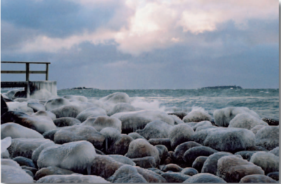
Ville Paganus "Pakkanen"