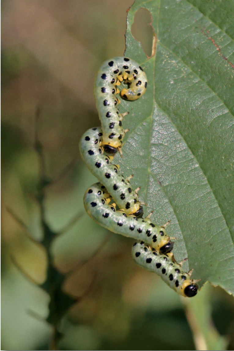
Iris Niemi "Nälkäiset"