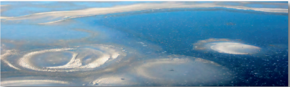
Jari Nokua "Meren muotoja"