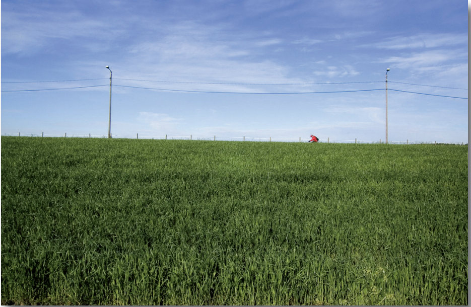
Teijo Kurkinen "Kevät"