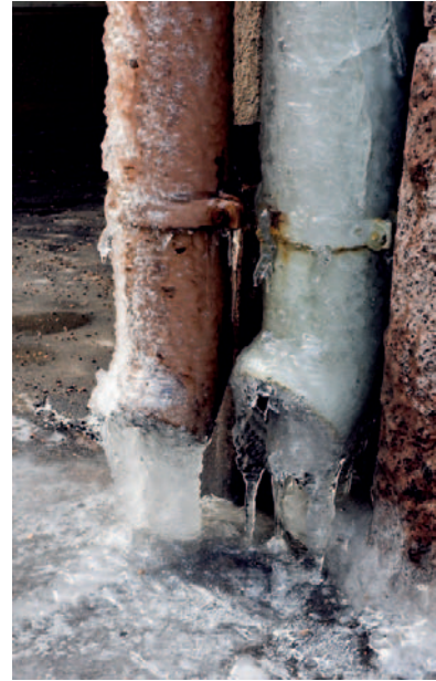
Nillo Anttonen ”Jäätäneet”

Naturassa korkeatasoiset luonnoitsijat esitelmöivät luontokuvan erilaisilla elementeillä. Sponsorit tekevät tuoteuutudet tunnetuksi heti tuoreeltaan. Kilpailuohjelma on seuran monipuolisin ja myös audiovisuaalisten diaohjelmien tekoon perehdytään. Kokoukset ovat kuukauden 4. tiistai klo 18.00 Kameraseurassa.