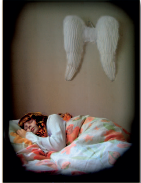
Monica Nordling "Sleeping Beauty"