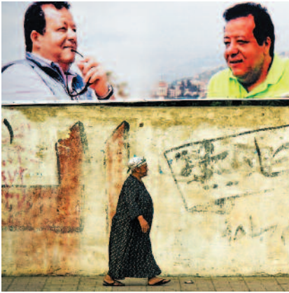
SEPPO TUOMAALA Katukuva Kairosta