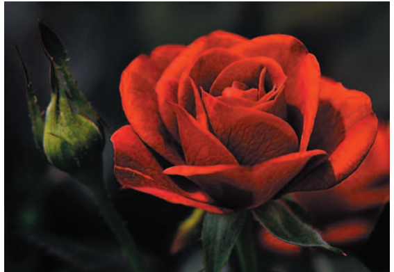
Vesa Jakkulan Ilo-Suru-Viha-Rakkaus