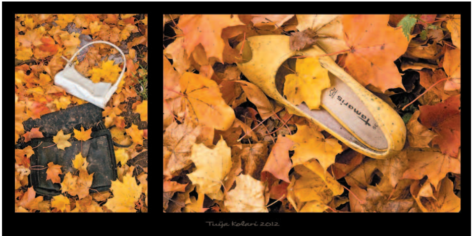
TUIJA KOLARI Autumn Fashion Collection