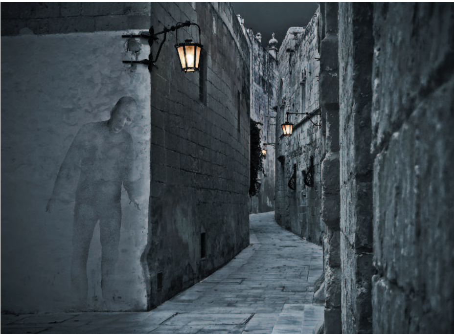
Fear of the dark