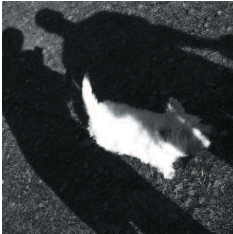
TOM NYBERG Black and white

Teeman tammikuun kokous on torstaina 10.1.2013 klo 18.00.