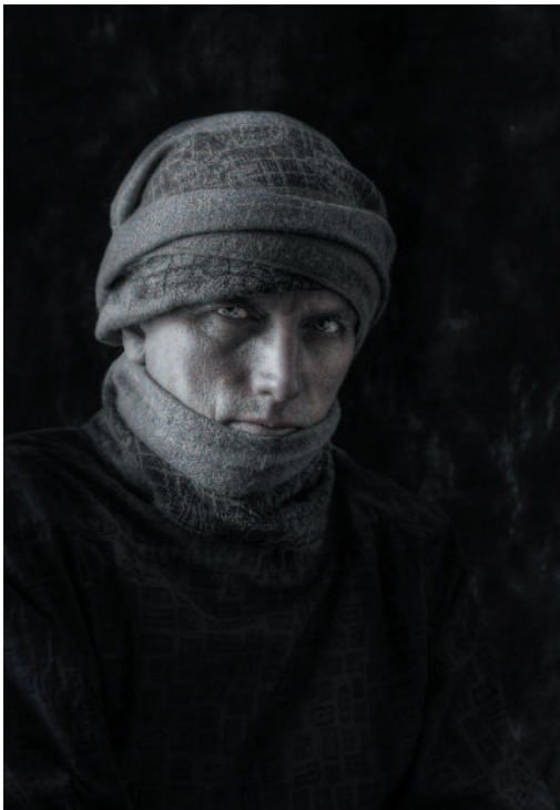
An angry man

Aukeaman kuvat ovat Jussi Jyvälahden Suurpalkintokilpailun voittokokoelma.