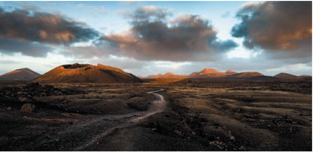
Aamun ensi säteet

Aukeaman kuvat ovat Jussi Jyvälahden Suurpalkintokilpailun voittokokoelma.