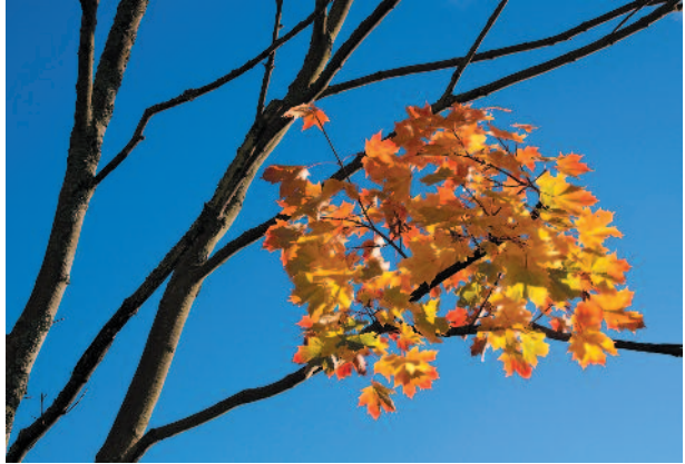
EIRA RANTANEN Vaahtera

Opintokerhon tulokasluokan kilpailut pidetään aina pöytäkilpailuna ja kuvaformaatti on vapaa. Siis kuvat tuodaan vasta kokoukseen ja saavat olla paperivedoksia, tiedostoja tai dioja. (max. 4 teosta / kuvaaja, teoksista yksi saa olla 4 kuvan sarja) Kilpailun lisäksi kukin saa tuoda 1 – 4 mielestään hyvää tai huonoa kuvaa keskustelun pohjaksi. Ideana on, että kuvaaja saa kommentteja kuvistaan, parannusehdotuksia kuvaamiseen, tai olisiko se omasta mielestä epäonnistunut otos sittenkin hyvä?