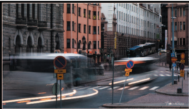
Sarjasta Aika 1-5