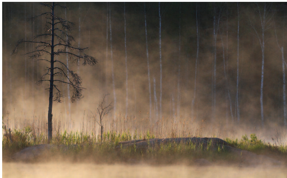
EERO HAUTA-AHO Sumuinen lampi