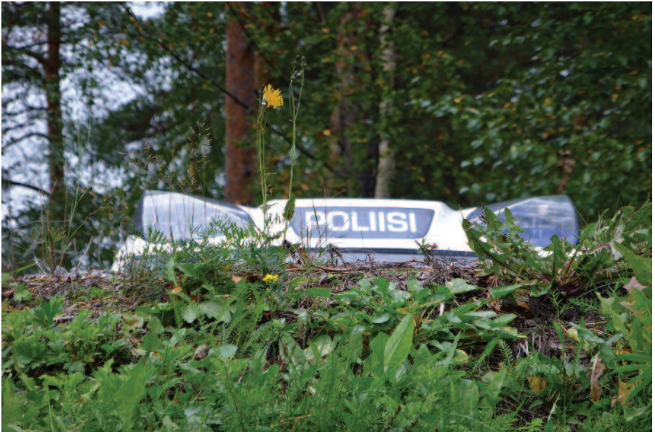
RAUNO POHJONEN Väijyteknikkaa