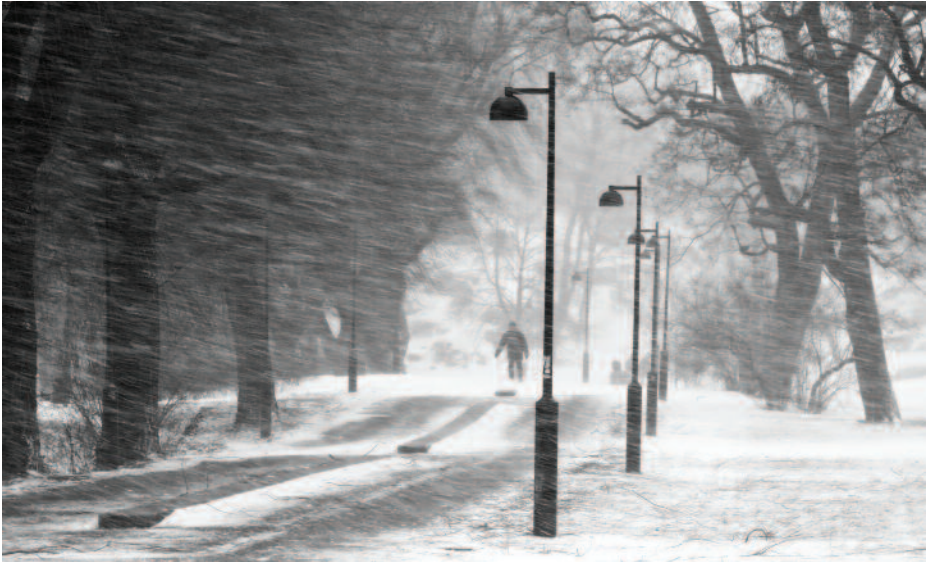
HELIMÄKI JUSSI Itätuulta