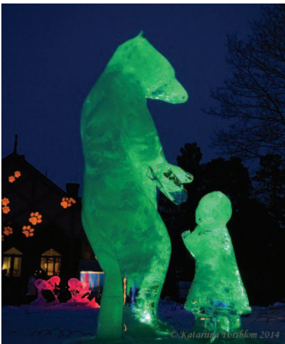
KATARIINA FORSBLOM Korkeasaari