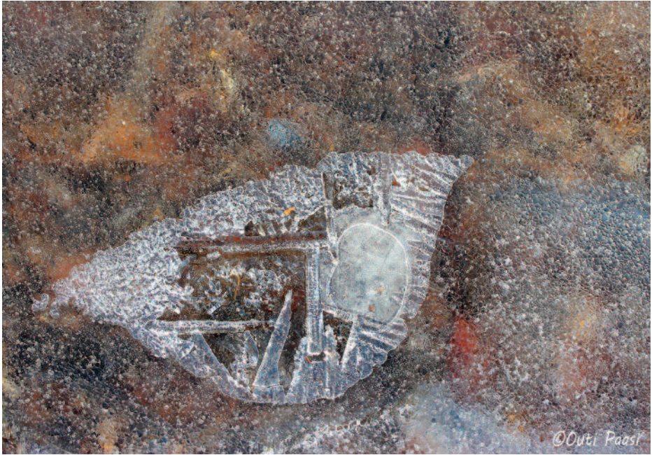
OUTI PAASI Seurasaari - Linnunlaulua jäällä

Suuren suosion saanut 72 lauantaita – näyttelymme siirtyi Kameraseuran galleriasta helmikuussa Jakomäen kirjastoon ja sieltä maaliskuussa Tapulikaupungin kirjastoon. Kevään viimeinen näyttelypaikka on Etelä-Haagan kirjasto, jossa näyttely on esillä 12.4. – 10.5. Kesätaun jälkeen 72 lauantaita voi vielä nähdä Pasilan kirjastossa lokakuussa.