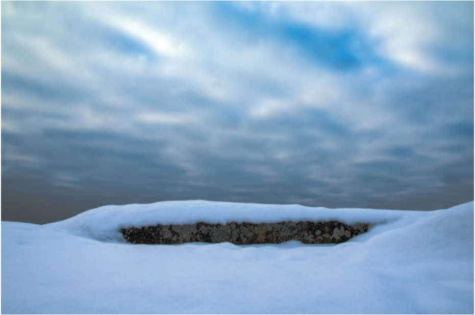
LASSI RITAMÄKI Suojassa

mentoinnista neliön tai suorakulmaisen valokuvan sisään tulee esiin siinä, että Irmeli on käsitellyt kuvia rajaamalla ne vapaalla kädellä piirtäen, jolloin kohde jää ikään kuin "lätäkön" sisään, vapautuen tyypillisestä muodosta. Ehkäpä siten myös kuvattu akvaariokala vapautuu sitä rajaavista lasiseinistä. Projektille nimen keksi Irmelin perheenjäsen, joka sanoi että kalathan "näyttävät olevan aivan kuin lätäkössä."