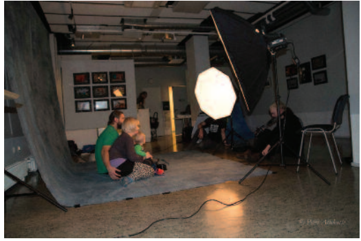
Kuva Personan minityöpajasta

Samanaikaisen digikuvauksen perusteet kurssilta saimme tauon aikana muutaman kurssilaisen uskaltautumaan kokeilemaan käytännön harjoittelua kanssamme.