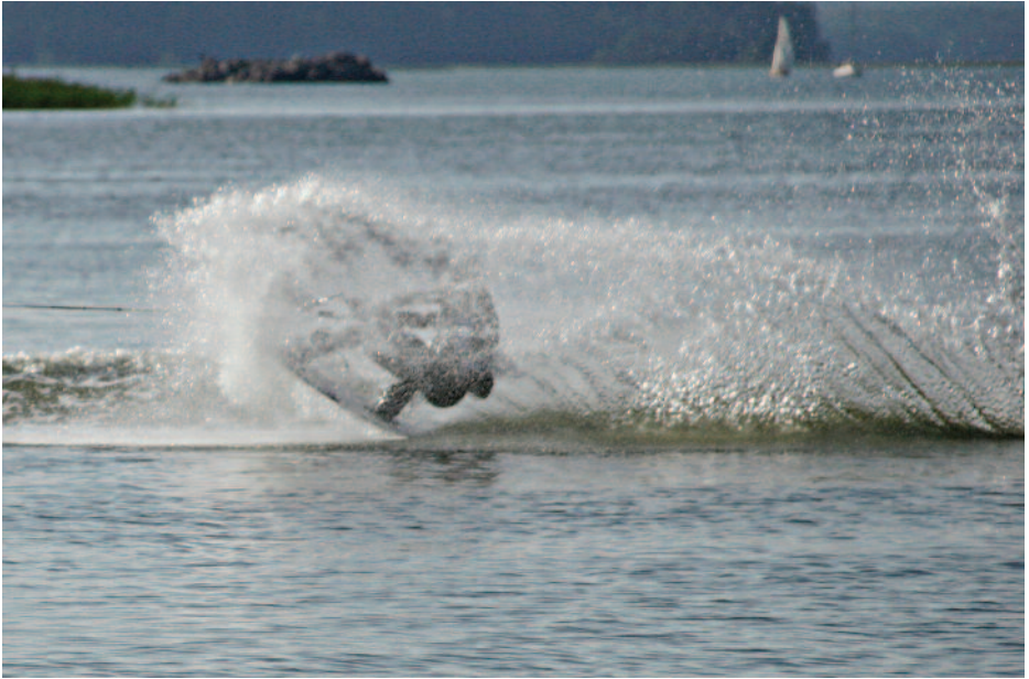
RAUNO POHJONEN Lautailija vesiverhon sisällä