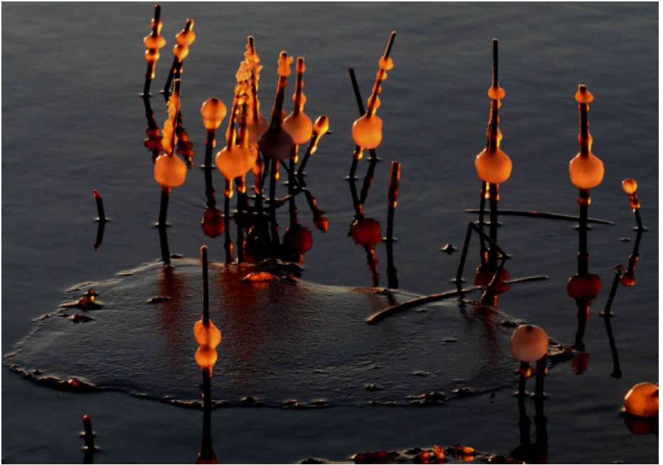
BURNING ICE, 2 p.