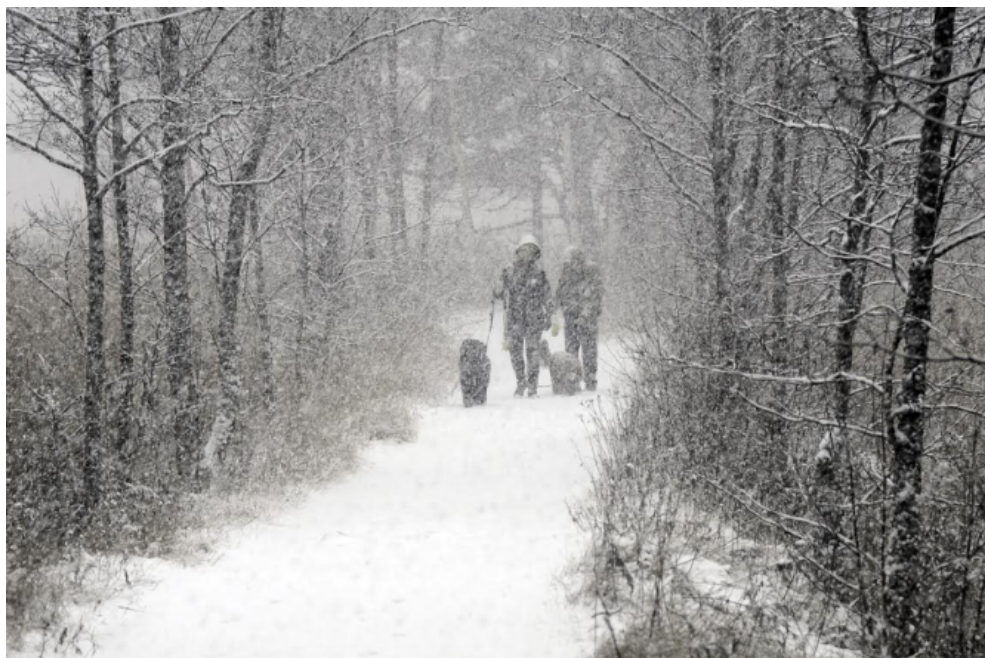
KOIRANILMA, 3 p.