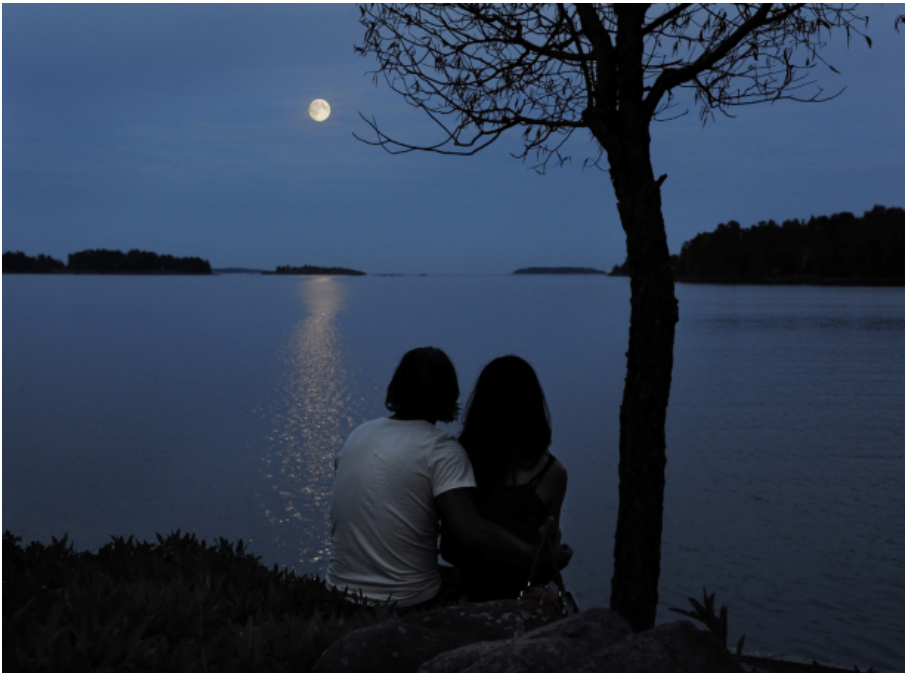
SUPERKUUTAMOLLA (1 p.)