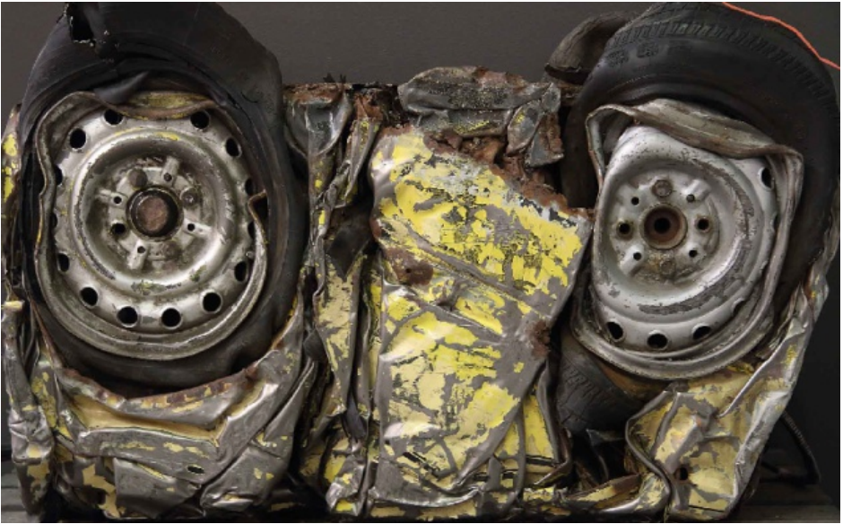
KIERRÄTETTYÄ TERÄSTÄ