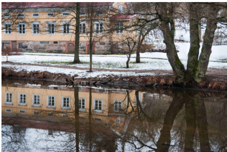
FISKARS - TALVEN PEILI