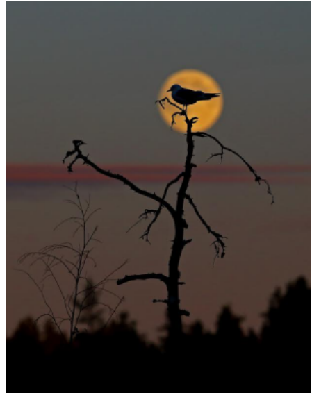
LOKKI JA KUU