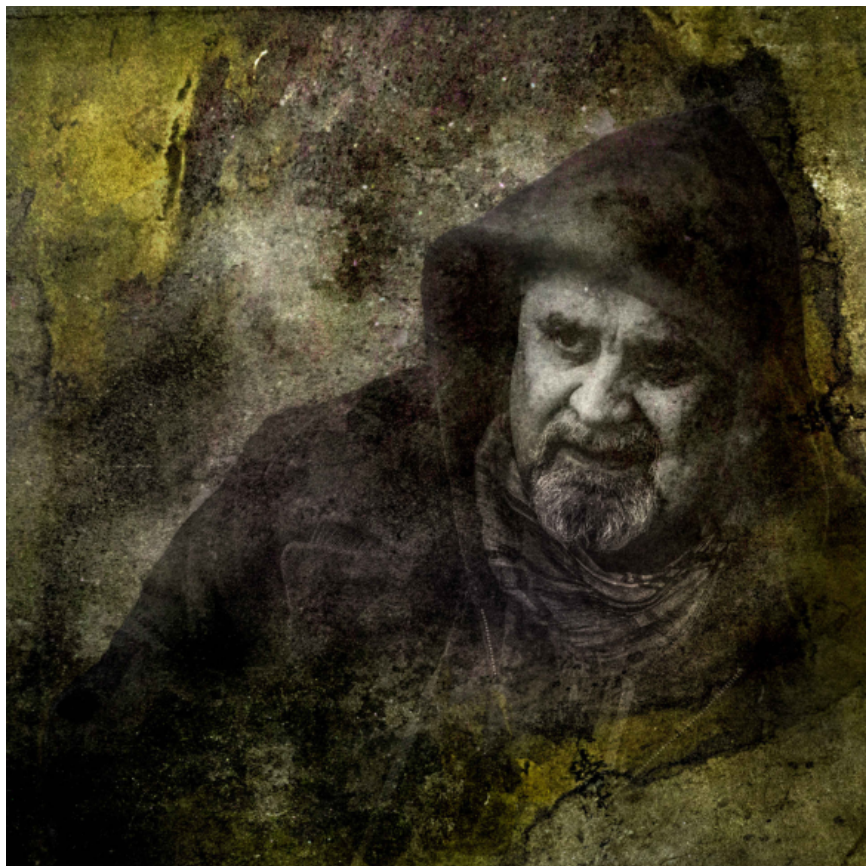
Kuva: Paula Lehtimäki HANDE