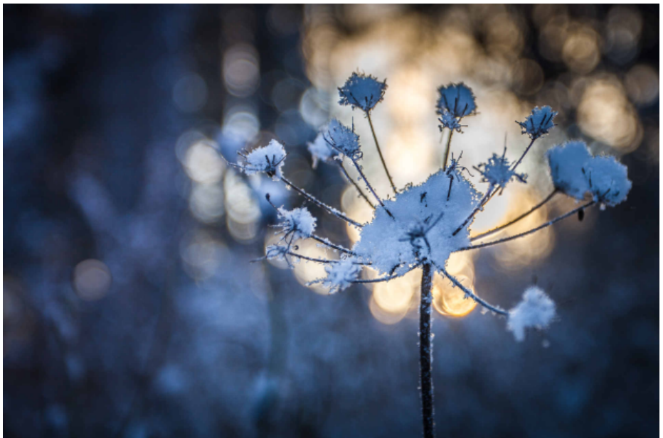
PILKAHDUS METSÄNRAJASSA 1p.