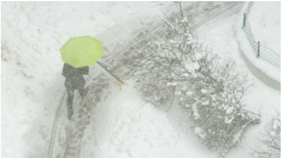
SOHJOA Haastekilpailun 2. sija