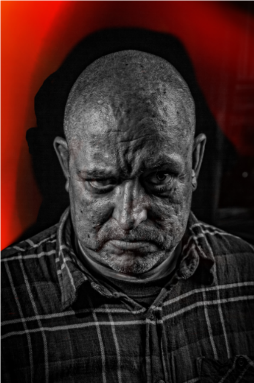
Kuva: Hannu Hietarinne BROIDI