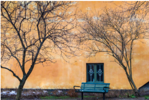
PYSÄHDYKSEN PAIKKA