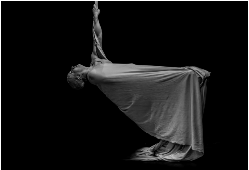
Kuvat: Hande Hietarinne PATAREI (ylh.) ja CIRKO STILL (alh.)