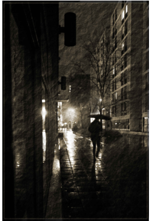
PASILAN MARRASKUU