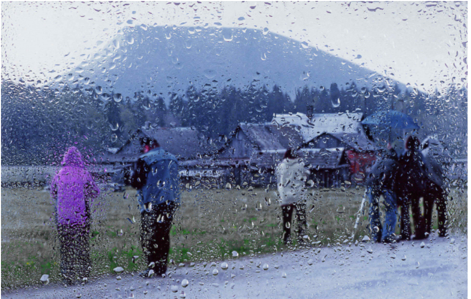
TUHKAVUORI SATEELLA Haastekilpailun voittaja