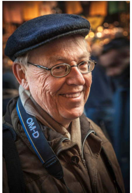
Kuva: Paula Lehtimäki OLYMPUS-MIES