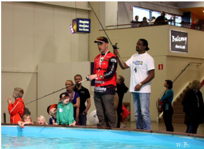
KALAA TULEE

Monet kävivät myös kuvauttamassa itsensä Kameraseuran ständillä, jossa vetäjät ottivat muotokuvia messuvierasta.