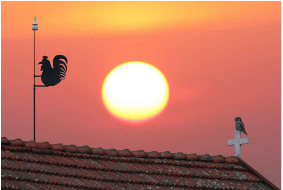
HIIRIPÖLLÖ (1 p.)